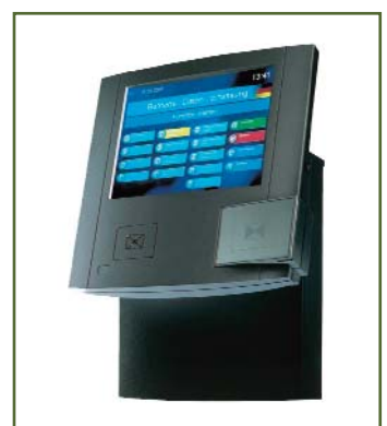
Kaba BDE-Terminal B-Net 95 80

www.adicom.com info@adicom.com Fon: +49 (0)62 01 80 80 00